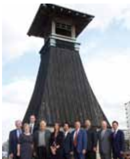
55周年訪問団、今津灯台にて