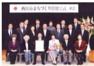
西宮市まちづくり賞 贈呈式